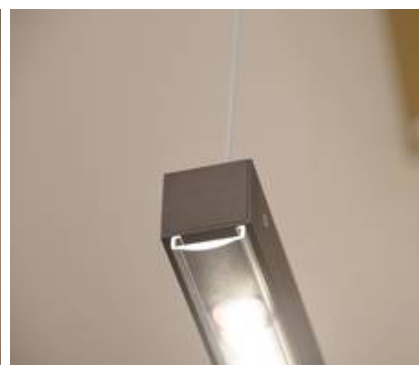
Aluminium in einem Baubronce-ton, ohne Glas