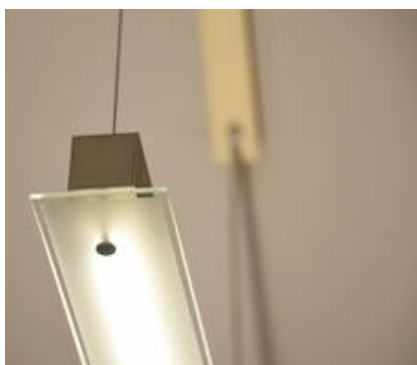
in einem Goldton, Glas mattiert mit klarem Rand am Streifen